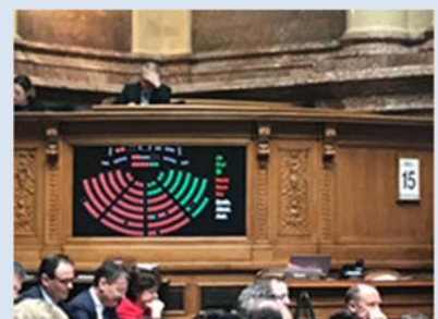
Eine mutige EVP – Stimme im roten Mitte-Rechts-Meer.