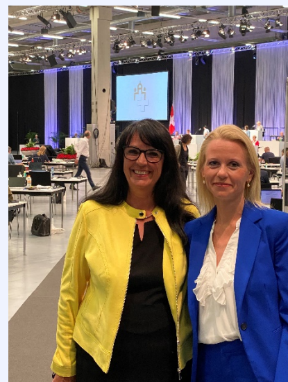
Die beiden EVP-Nationalrätinnen in den EVP Farben im Gelände der Bernexpo.