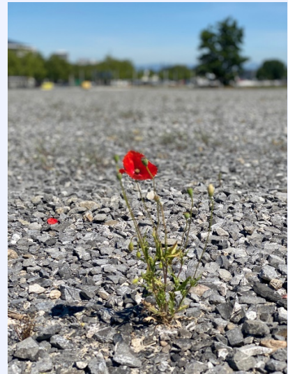
Aussenplatz beim Bernexpo-Gelände, ein passendes und hoffnungsvolles Bild zur CO 2 -Debatte.

Mit den Stimmen der EVP folgte die Mehrheit des Nationalrates dem Ständerat und verabschiedete Massnahmen, um die Treibstoffimporte stärker zu kompensieren. Der Benzinpreis kann dadurch künftig um maximal 12 Rappen erhöht werden.