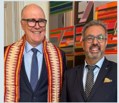
Arbeitsbesuch bei Bundesrat Martin Pfister.