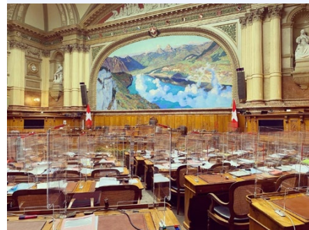
Abendstimmung im Nationalratsaal

Impressum: Verfasst und gestaltet von Marianne Streiff Nik Gugger Lilian Studer