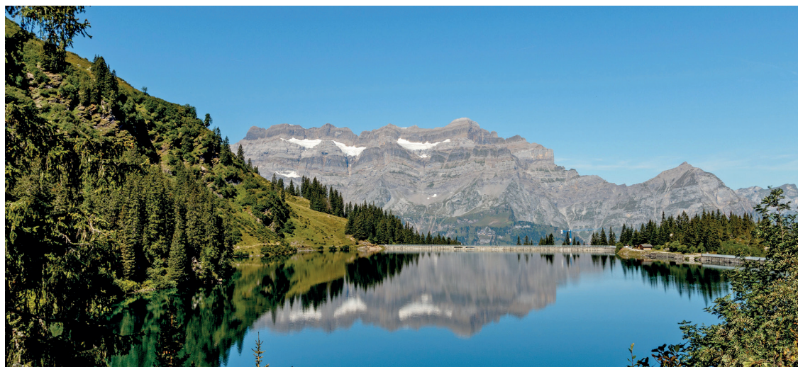
La Suisse – Château d'eau – oui! Des subventions supplémentaires sont-elles le bon moyen?

L'initiative parlementaire Heim «Exploiter et développer intelligemment le potentiel qu'offrent les salariés âgés sur le marché du travail» veut mettre en place des bases légales afin d'accroître les chances des salariés âgés de rester sur le marché du travail ou de s'y réintégrer. Le problème est encore et toujours d'actualité, mais la solution proposée n'a pas convaincu, ni le PEV, ni les autres partis. Les mesures proposées en