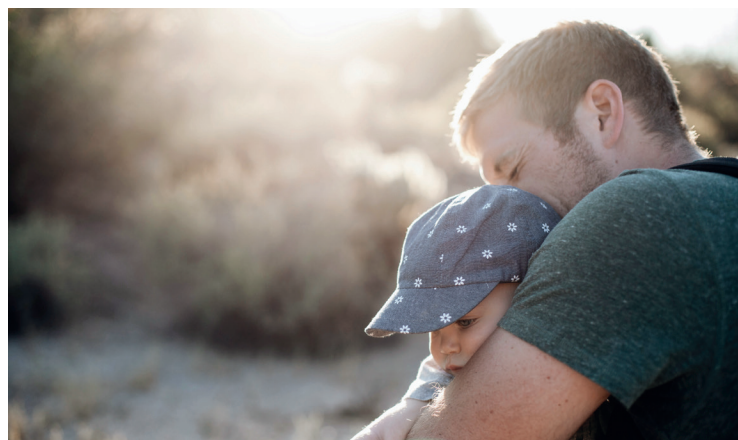
Les pères ne peuvent s'engager plus dans l'éducation des enfants que lorsqu'ils peuvent travailler à temps partiel.

Le PEV a soutenu une initiative parlementaire de Nadine Masshardt qui veut accorder aux mères et aux pères actifs le droit à une réduction du taux d'occupation de 20% maximum après la nais-