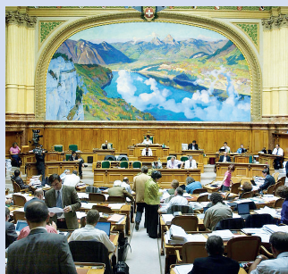
Interpellation de Maja Ingold