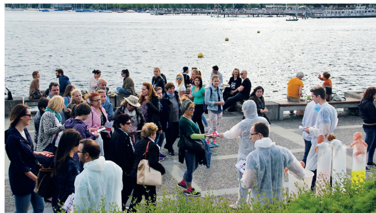
Une action *jevpev en juin 2016 avant la votation sur le diagnostic préimplantatoire

Tout en étant membre du comité central suisse du *jevpev, j'exerce la fonction de coordinatrice en Suisse romande. J'ai particulièrement à cœur de sensibiliser les jeunes aux questions politiques et je souhaite les motiver à un engagement citoyen selon leurs possibilités. Ainsi je me tiens à disposition pour soutenir les personnes souhaitant s'impliquer. Vu que la plupart des activités nationales se déroulent en allemand, je fonctionne également en qualité de traduc-