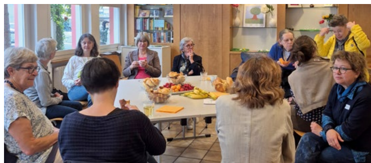
«Sichtbar – Mutig – Kompetent» – Titel der Frauentagung 2026.

Vermot von «Friedensfrauen weltweit» erinnerte daran, dass Frieden nicht durch Waffen entsteht, sondern durch Zuhören, Verstehen und Durchhalten – Arbeit, die Frauen täglich leisten, oft unsichtbar. Workshops am Nachmittag halfen, diese Stärken sichtbar zu machen. Melanie Beutler-Hohenberger fasste zusammen, was den Tag prägte: «Jede von uns bringt etwas mit.» (Monika Loosli)