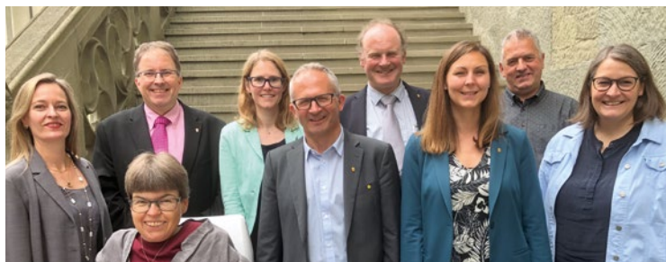
Die EVP-Grossratsfraktion möchte Sitze dazugewinnen.