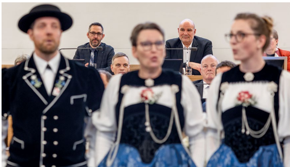
Der Jodlerklub Roggliswil singt zu Ehren des frisch gewählten Grossratspräsidenten.

Veranstaltungen sind schön und man trifft viele interessante Leute. Aber wer mich kennt weiss, dass ich immer ungeduldig bin und etwas machen muss. Ich gestehe also, dass die Leitung der Ratssitzung mir enorm Freude bereitet inklusive der dazugehörigen Vorbereitung. Die sind zwar sehr intensiv und anstrengend, aber es läuft die