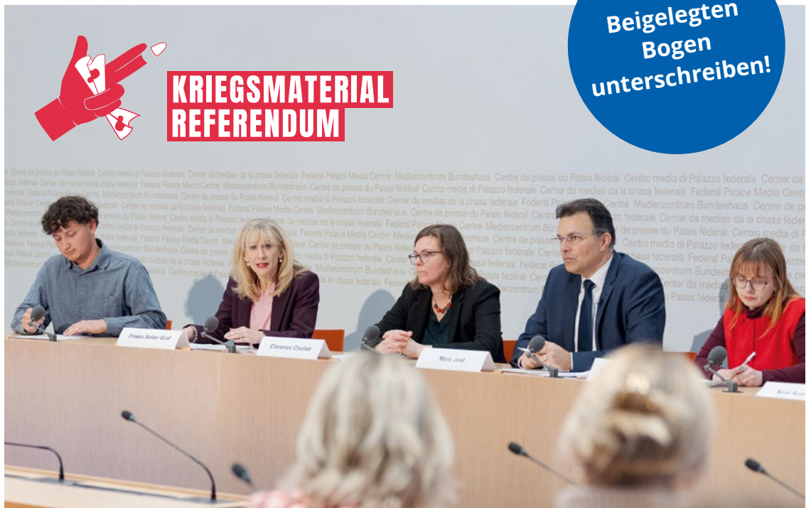
Eine breite Allianz aus Parteien und Friedensorganisationen hat das Referendum ergriffen.

Schweizer Waffen sind in der jüngsten Vergangenheit immer wieder in Bürgerkriegen aufgetaucht – von RUAG-Granaten beim IS in Syrien bis zu Sturmgewehren im Jemen. Deshalb hat die Schweiz eines der verantwortungsvollsten Kriegsmaterialgesetze der Welt eingeführt. Es soll verhindern, dass wir Teil von Kriegen werden oder massive Menschenrechtsverletzungen begünstigen. Nun will das Parlament diese klaren Regeln lockern. Dagegen ergreifen wir das Referendum. Unterschreiben Sie jetzt – der Bogen liegt bei.