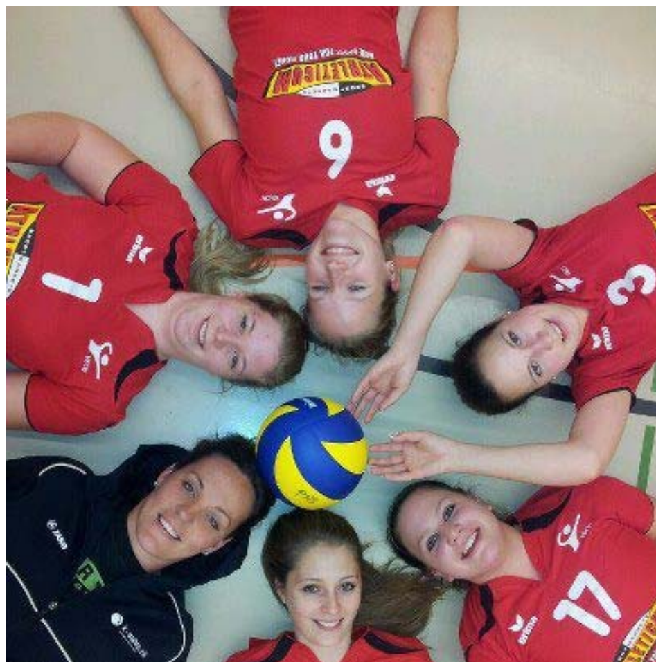
Der Nachwuchs des Volleyballclubs Wittenbach