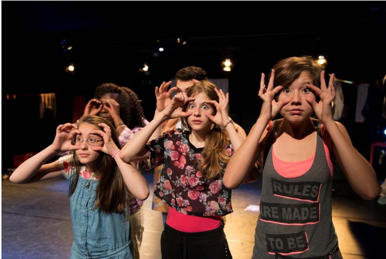
Das Jugend Theater Festival Schweiz