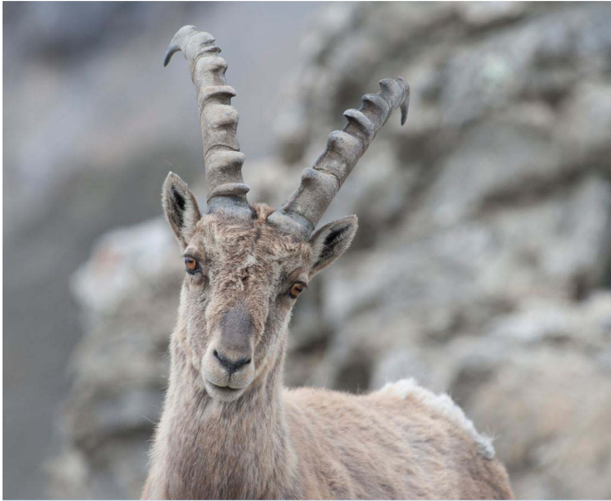
Der Schweizerische Nationalpark